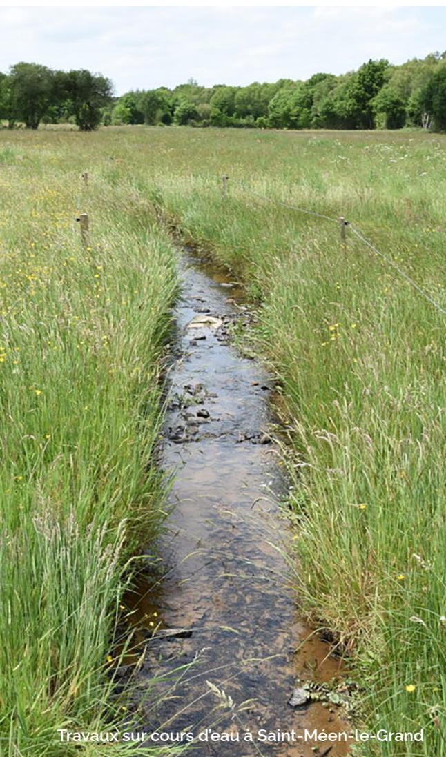
Travaux sur cours d'eau à Saint-Méen-le-Grand