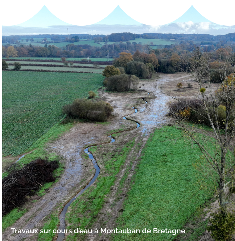
Travaux sur cours d'eau à Montauban de Bretagne

Vous trouverez sur la carte le contact des techniciens selon votre localisation :