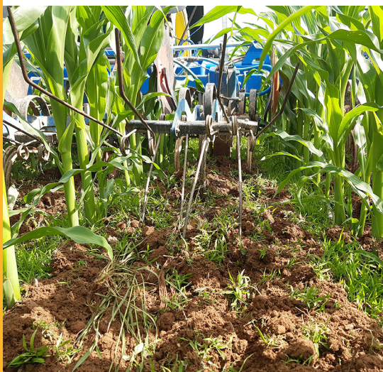
Baisse de l'IFT après passage en désherbage mécanique (100ha accompagnés par la Chambre d'Agriculture)

Pour réduire l'utilisation des produits phytosanitaires sur le territoire, Eaux & Vilaine promeut le désherbage mécanique , en collaboration avec les partenaires techniques, à travers plusieurs programmes de formation et d'accompagnement.