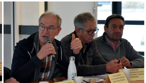
Comité syndical d'Eaux & Vilaine, le 6 mars 2026