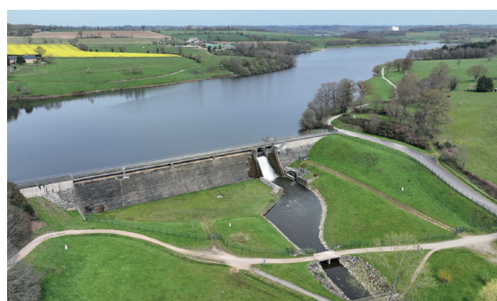
Barrage de la Cantache

Avec le barrage estuarien d'Arzal, les 3 barrages de la Vilaine amont situés à Vitré : Haute Vilaine, Cantache et Valière, font partie des ouvrages hydrauliques structurants gérés par Eaux & Vilaine. Multi-usages, ils assurent 3 fonctions principales : la prévention des inondations, l'alimentation en eau potable et le soutien d'étiage en garantissant les débits nécessaires au maintien de la vie biologique et aux différents usages en amont du bassin.