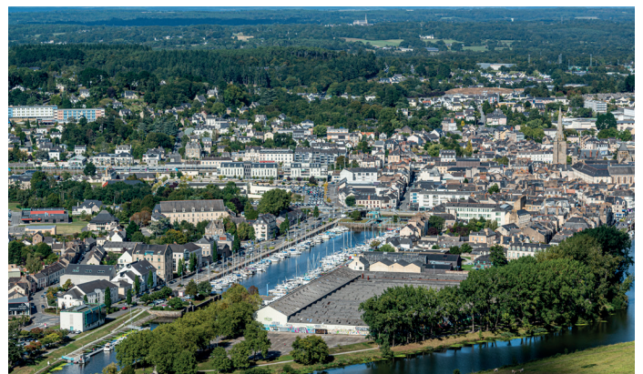
Vue sur l'île de Redon

Les dépenses engagées par la commune seront refacturées à Eaux & Vilaine. La phase Projet est en cours avec le maître d'oeuvre agréé (SCE). Le projet doit entrer en phase réglementaire en 2026, avant une enquête publique et des travaux attendus en 2027.