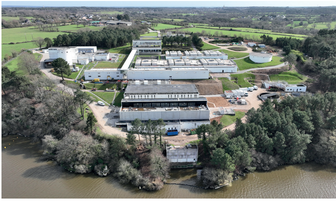
Usine d'eau de Vilaine Atlantique