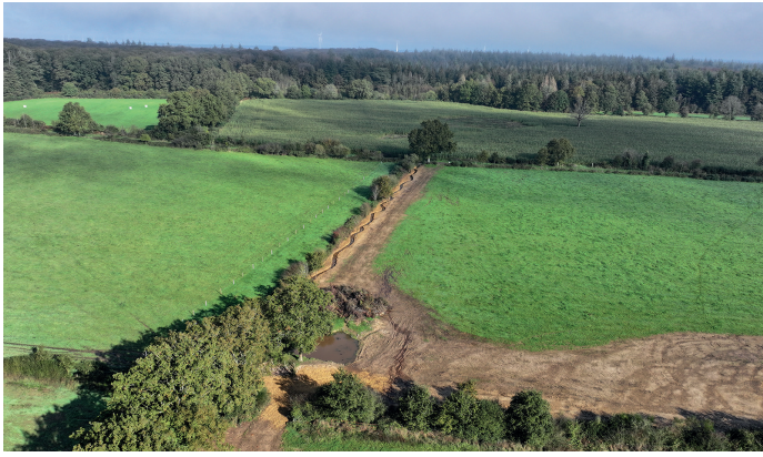
Restauration du cours d'eau à Villepot