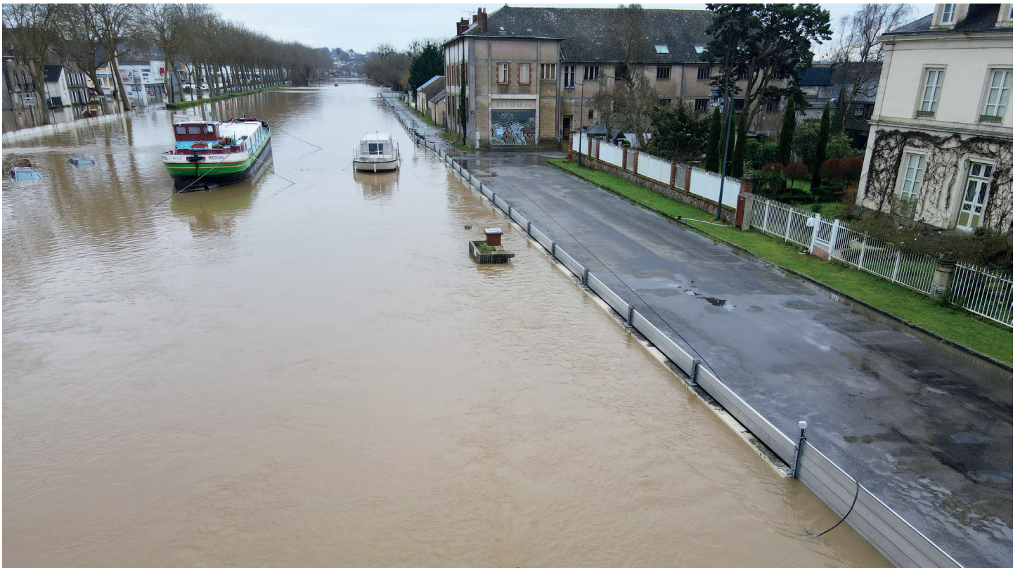
Systeme d'endiguement sur la commune de Saint-Nicolas-de-Redon, janvier 2025