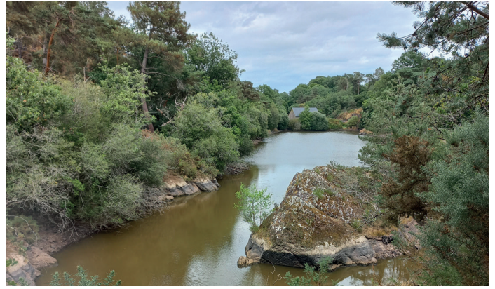
Étang de l'Etunel, situé sur les communes de Treffendel et Monterfil

Afin de maintenir l'équilibre économique du contrat, certaines prestations initialement prévues sont supprimées ou reportées, générant une réduction de charges de 424 204 €. Le solde restant sera absorbé par les marges du délégataire. Un avenant au contrat a ainsi été proposé par le Collège Eau potable et adopté en Comité syndical.